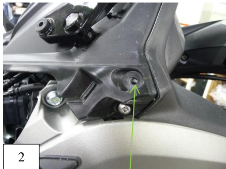
Rivet plastique à enlever de chaque côté