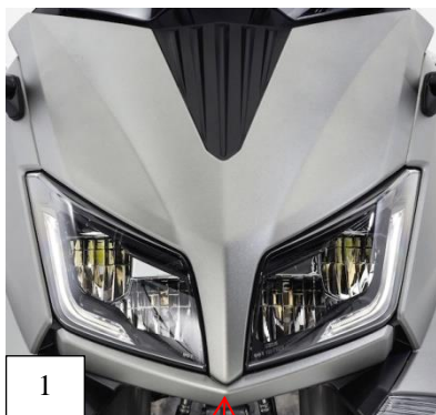
1 Lower cover