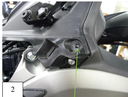
2 Plastic rivet to remove on each side